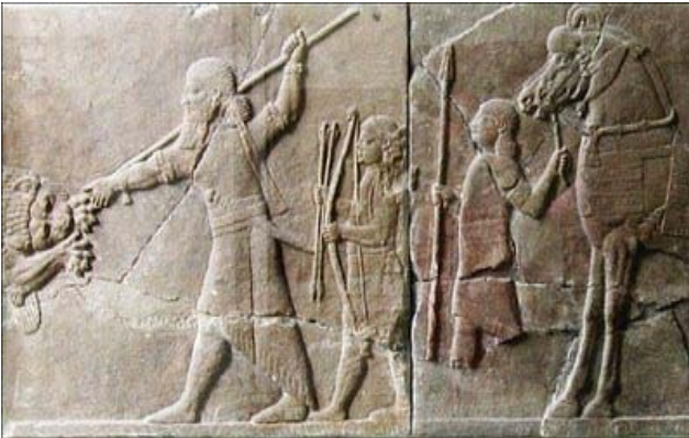
Uno de sus Monarcas Guerreros

De la persona del profeta Nahum y su obra se conoce muy poco, pues no da ningún dato histórico de sí mismo en su obra, tampoco se le menciona en el Antiguo Testamento. Solamente el poder decir que era de Elcos. Se han propuesto cuatro lugares de ubicación de esta ciudad, algunos la sitúan en Mesopotamia, al norte de Mosul, cerca del río Tigris. Nestorio fue el primero que sugirió este lugar y existe todavía “una tumba de Nahum”, encontrada cerca de una ciudad llamada Elqush.