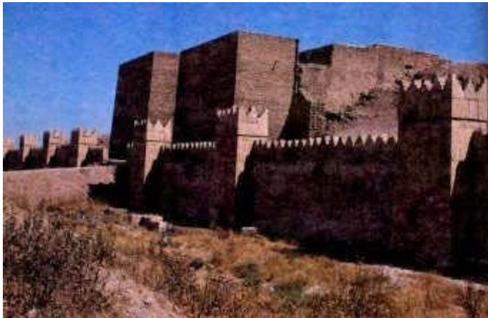
Ciudad de Nínive 3

Según muestra el libro de Nahum, indica que el inicio de su ministerio se ubica entre las fechas de dos acontecimientos de acuerdo a las evidencias internas. Los mismos se refieren a: el primero, se refiere a la destrucción de la ciudad de Norte en Egipto, (Norte-Amón, Tebas, destruida el 663 a. de C., por el emperador asirio Asurbanipal).