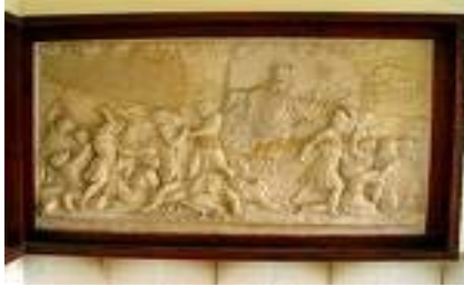
Relieve de la confrontacion